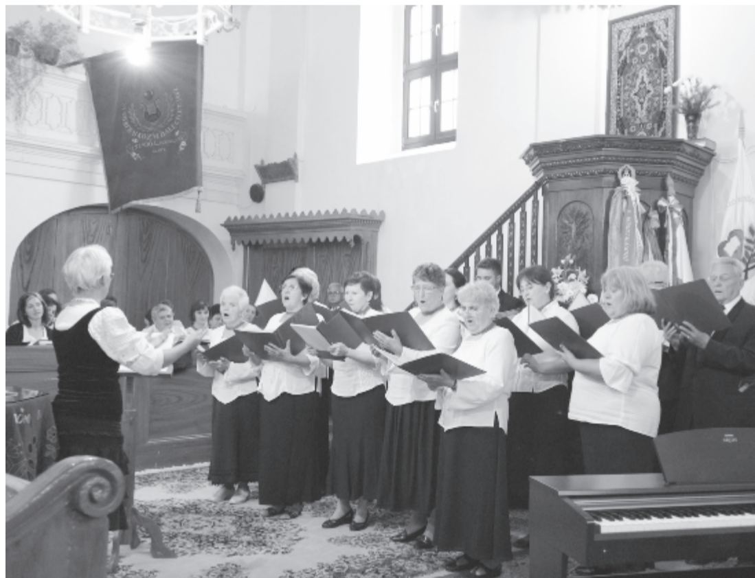
Kilenc kórus lépett fel a főtéri református templomban

A vasárnapi rendezvény a második abból a négyes sorozatból, amelyet az idén szerveznek Nyárádszereében a helyi karénelklés 150 éves múltja tiszteletére. A településen 1868-ban alakult meg a dalkör, amely temetéseken, játékonysági előadásokon énekel, húshagyókedden előadásokat szervezett. Bocskai István szobrának első leleplezését (1906. jún. 17.) is „a Bocskai-kör énekara a Szózzattal köszöntötte” – írja egy korabeli újságcikk. Néhány napja, május 21-én gyermekkórusok találkoztak a szereadi művelődési házban, július 8-án a női dalkör 30. évfordulója alkalmával tartanak nemzetközi kórustalálkozót, október 14-én pedig férfikarok találkoznak a városban. (gligor)