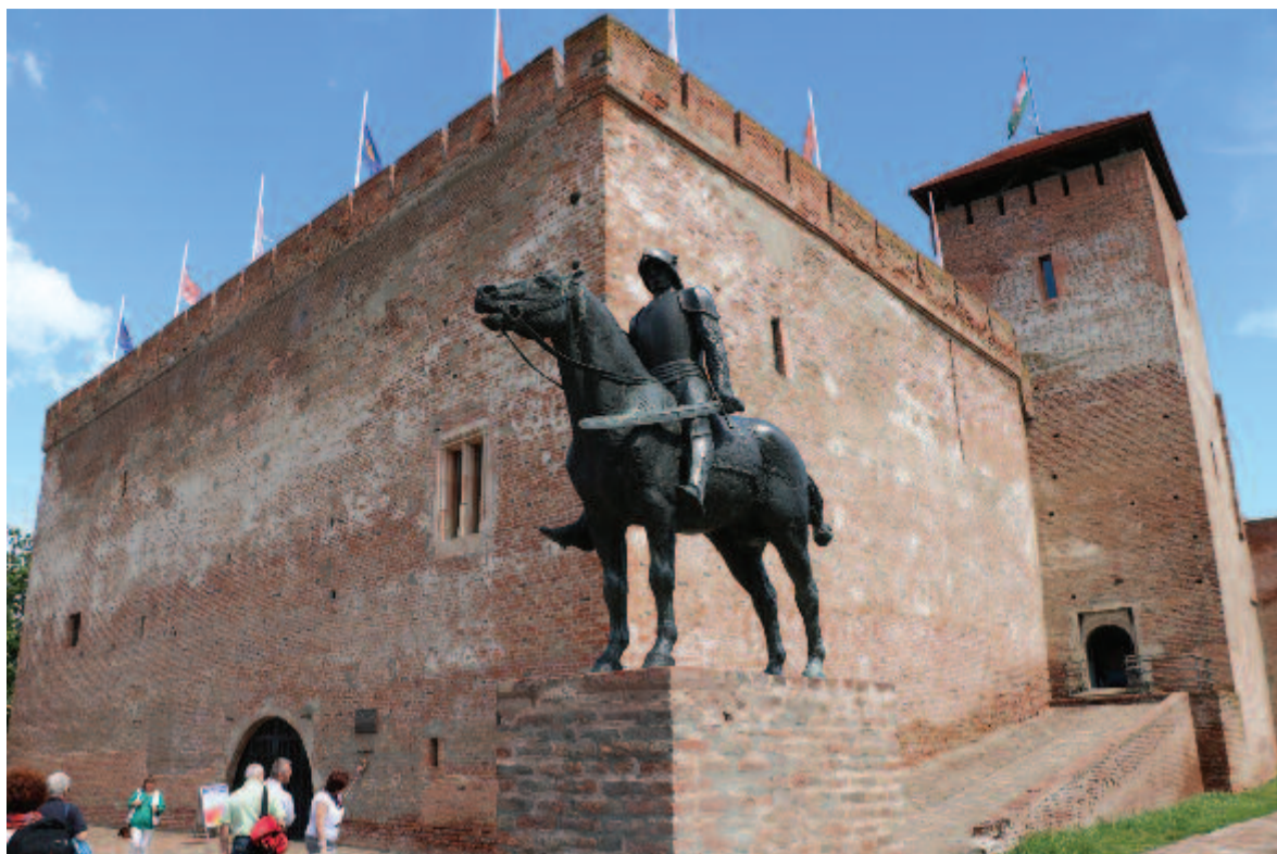
A gyulai vár

– Valóban nem tartottak még ilyen rendezvényt. De arra számítottunk, hogy ha kellően népszerűsítjük a rendezvényt, jönni fognak az irodalombarátok, az érdeklődők. Néhány évvel ezelőtt Marosvásárhelyen, a Sütő András-konferencia